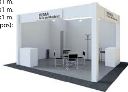
Dibujo orientativo Design for information purposes only