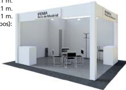
Dibujo orientativo Design for information purposes only