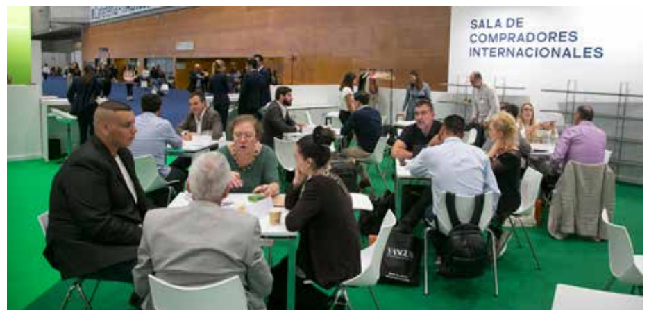
Cada año se celebra en Salón Look el Programa de Compradores Internacionales en colaboración con ICEX y STANPA.

La Industria española de Perfumería y Cosmética está demostrando ser una de las más competitivas y dinámicas dentro de los difíciles contextos que tenemos que gestionar en la actualidad. ■