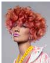
Colección El Grito y El Silencio, Amparo Fernández para el colectivo Flapping Wings.