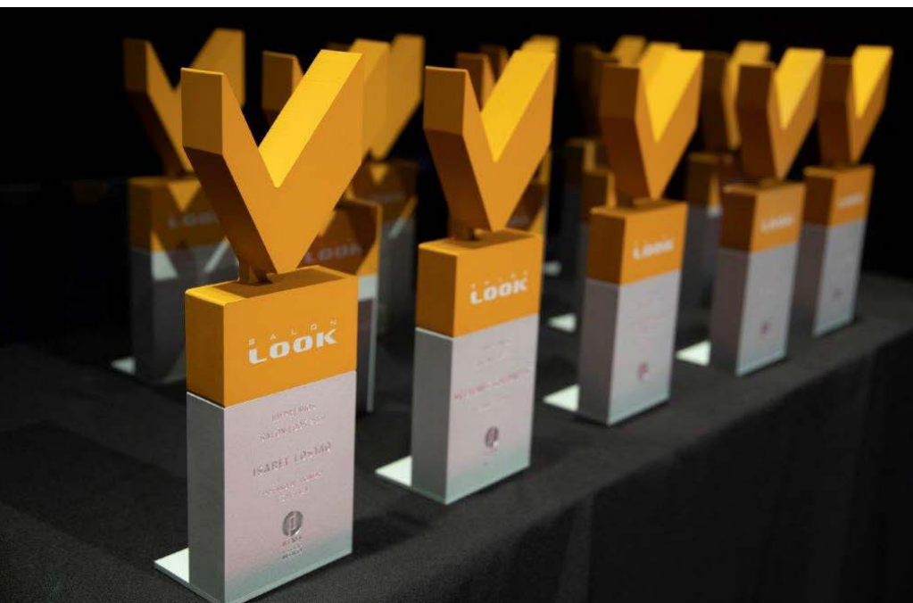
Premios Salón Look.

El Salón Internacional de la Imagen y la Estética Integral, que se celebrará del 13 al 15 de octubre de 2023, lanza la nueva convocatoria de los Premios Salón Look, cuyo plazo de presentación de candidaturas para los Premios, estará abierto hasta el próximo 30 de abril de 2023.