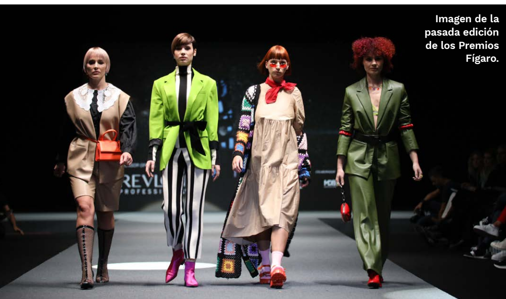
Imagen de la pasada edición de los Premios Fígaro.

El Salón Internacional de la Imagen y la Estética Integral se desarrollará del 13 al 15 de octubre en los pabellones 12, 14 y 14.1 del Recinto Ferial de IFEMA MADRID. La coincidencia con la celebración del Congreso Internacional de Oncología, el encuentro más importante a nivel mundial de esta especialidad clínica ha motivado la decisión de adelantar LOOK para facilitar la asistencia de profesionales del sector de la Peluquería y la Estética de toda España ante la plena ocupación hotelera que tendrá Madrid durante el congreso.