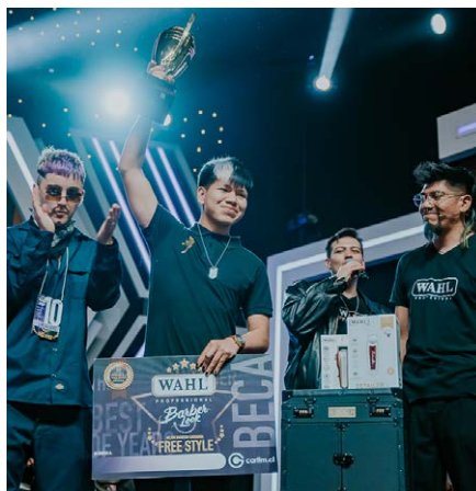
Salón Look Santiago 2022.