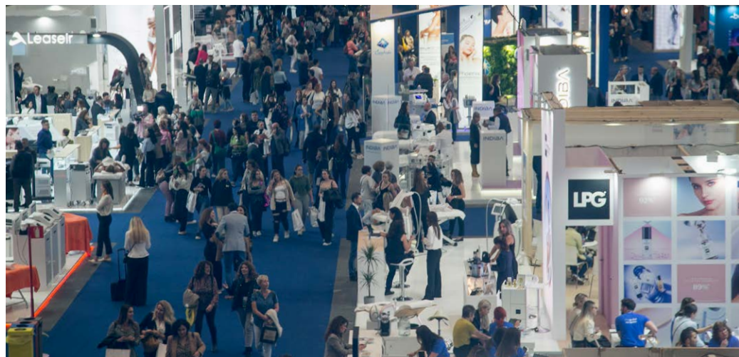
Instantaneas de la pasada edición de Salón Look.

Descubre toda la información en: www.salonlook.ifema.es