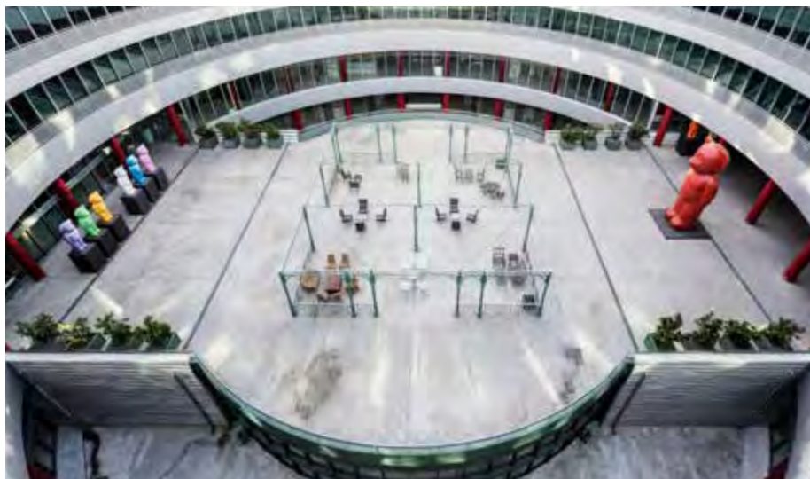
IFEMA, una apuesta firme por la internacionalización.

importadoras y/o distribuidoras de productos cosméticos, especialmente de aquellos destinados a la venta en canal profesional como salones de belleza, spas, clínica médico-estéticas y peluquerías, pero también otros productos de venta retail. Así, los días 19, 20 y 21 de octubre se celebrarán más de un centenar de reuniones online, una oportunidad única para posicionar nuestros productos Beauty from Spain en países como Colombia, Perú, Ecuador, Chile, México y República Dominicana. ■