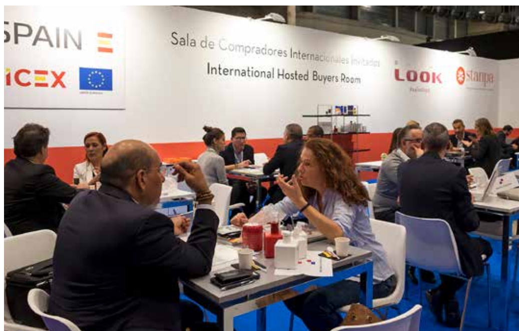
Programa Internacional de Compradores en la pasada edición 2019 de Salón Look.

SALON LOOK INTERNACIONAL se ha reinventando para seguir siendo