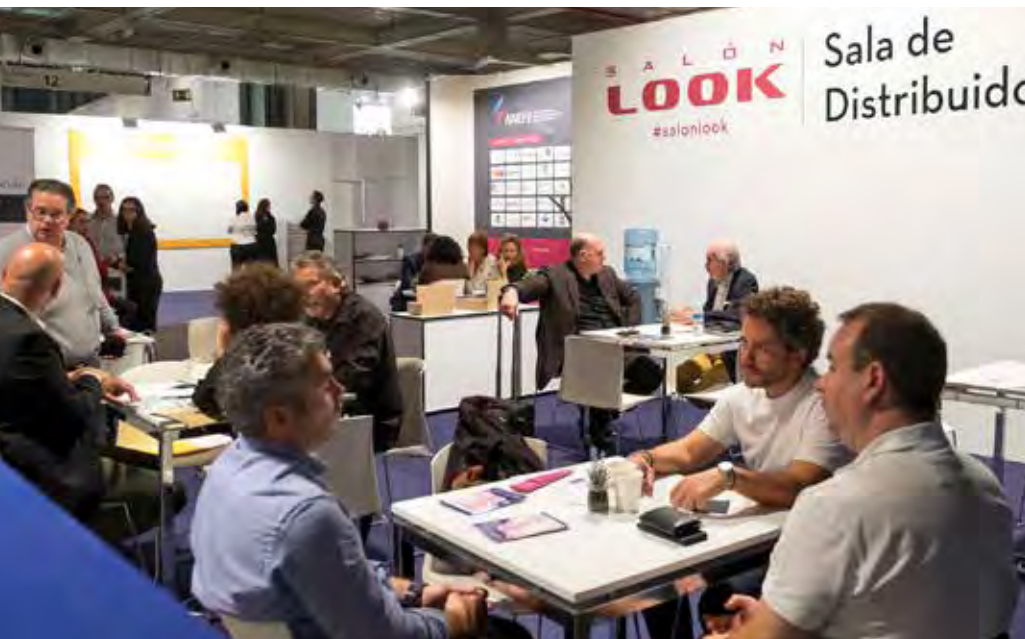
Imagen de la Sala de Distribuidores habilitada en Salón Look 2019.

Marzo será el mes en el que arranque el calendario, y lo hará con la Feria de Arte Contemporáneo ESTAMPA, a la que le seguirá una amplia lista de convocatorias que se celebrarán con todas las medidas y sistemas de seguridad para garantizar la participación en las mejores condiciones.