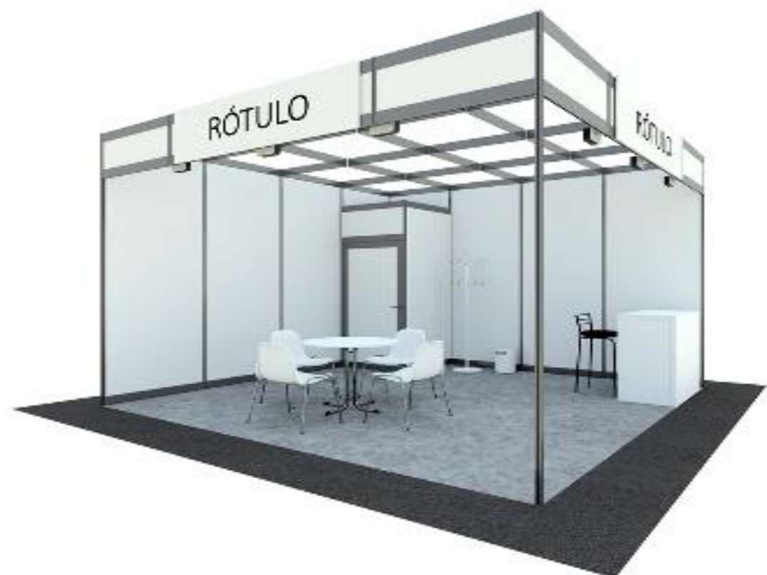
Stand llave en mano “todo incluido” Modular BASIC