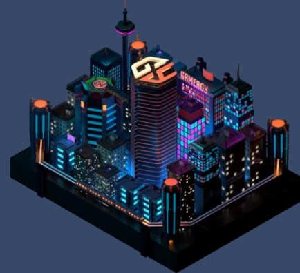
Maqueta de GAMERGY World

20 Salas Temáticas para Partners. Recreación Virtual 3D de GAMERGY. Experiencias gamificadas personalizadas.