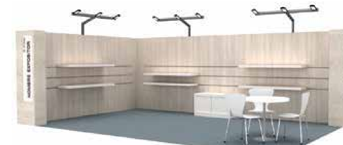
Ejemplo Stand Modular con baldas DIBUJO ORIENTATIVO