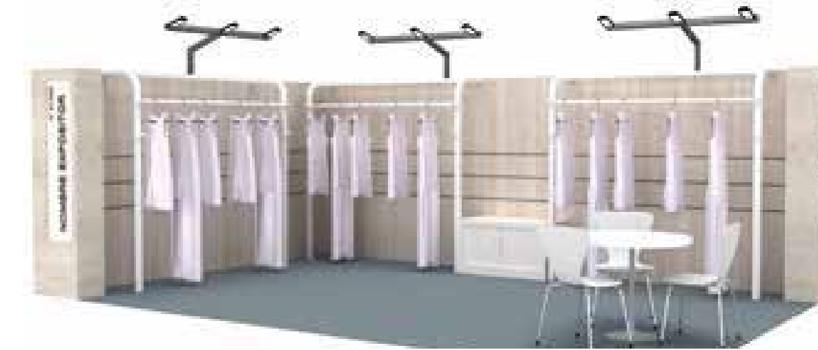
Ejemplo Stand Modular con percheros DIBUJO ORIENTATIVO