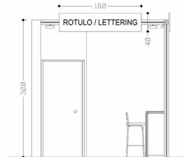
MESA ENCUENTRO SCHOOLS DAY