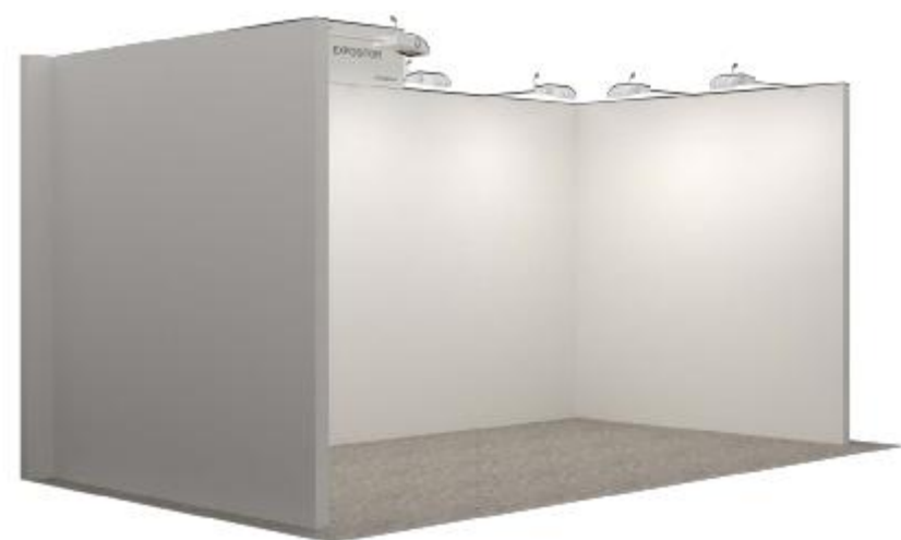
STAND tipo Galería