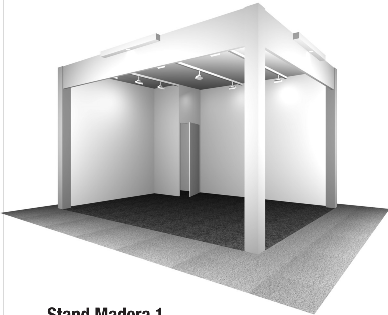
Stand Madera 1