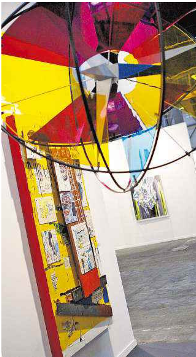
Obras de Basquiat y Olafur Eliasson en el «stand» de Elvira González