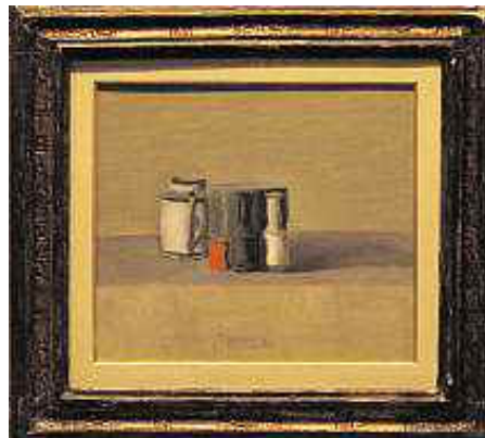
Arriba, «Naturaleza muerta», de Morandi, en Leandro Navarro. A la derecha, obra de Alex Katz

pies en la feria, pero mucho menos presente este año Juan Muñoz. El martes, Sotheby's subastaba en Londres su obra «Conversation Piece» por 3 millones de libras (3,6 millones de euros), nuevo récord del artista español. En el «stand» de Faggionato hallamos «Balcón de Malmö II», de 1991. Y poco más. Si seguimos con artistas españoles, Jaume Plensa nunca decepciona. Espléndido su alabastro de gran tamaño «Awilda VI» en Lelong. Tampoco Cristina Iglesias (una serigrafía sobre acero inoxidable curvo en Elba Benítez).