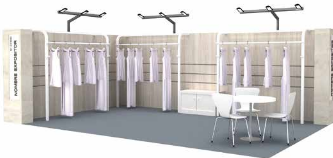
Ejemplo Stand Modular con percheros DIBUJO ORIENTATIVO