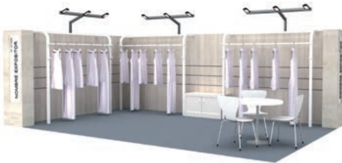
Ejemplo Stand Modular con percheros DIBUJO ORIENTATIVO