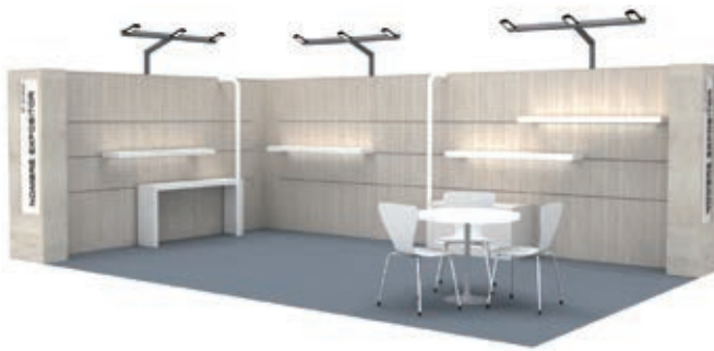
Ejemplo Stand Modular con baldas DIBUJO ORIENTATIVO