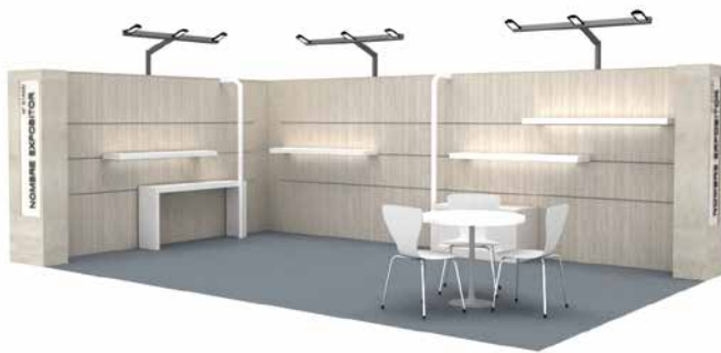
Ejemplo Stand Modular con baldas DIBUJO ORIENTATIVO