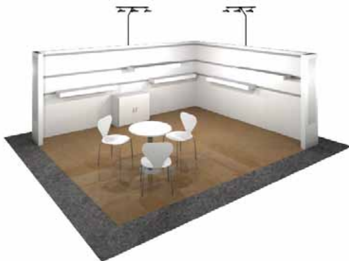
Ejemplo Stand Modular con baldas