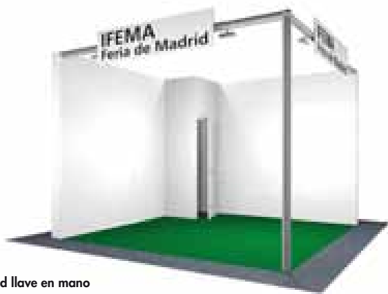
Stand llave en mano Dibujo orientativo