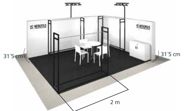
Ejemplo Stand Modular con baldas DIBUJO ORIENTATIVO