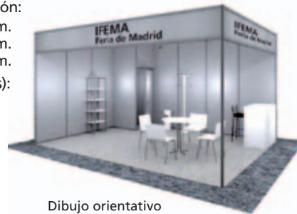
Dibujo orientativo Design for information purposes only