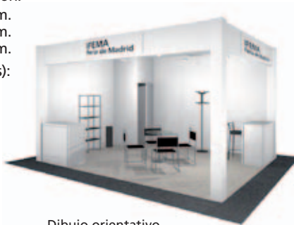
Dibujo orientativo Design for information purposes only